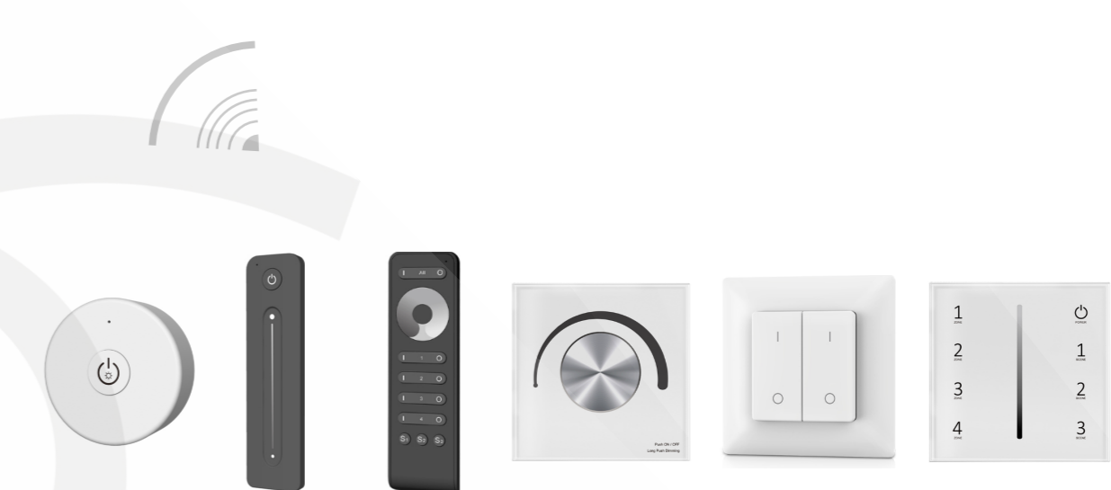
RF-управление пульты, кнопки и панели, управляющие контроллерами по радиосигналу